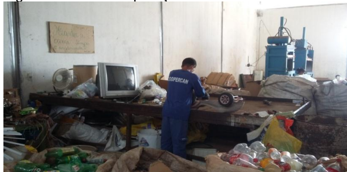
Figura 3 Local de separação dos materiais recebidos

Da mesma forma que a Cooperativa I, a segunda também recebe todo tipo de material reciclável que chega através do caminhão da coleta seletiva. O material recolhido é despejado na parte externa e logo em seguida levado para uma espécie de mesa (figura 3) onde o material é separado. A Cooperativa II não possui “funil” e nem esteira, pois o galpão da mesma é menor que o da primeira e não tem espaço suficiente para acomodar tais equipamentos.