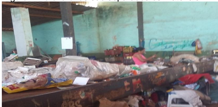
Figura 1 Esteira onde são separados os materiais

Na cooperativa I o material recolhido através da coleta seletiva é recebido através do caminhão da empresa responsável pelo serviço. O caminhão despeja o material recolhido em um equipamento chamado de “funil” acoplado a esteira (Figura 1) onde os catadores fazem a separação dos materiais.