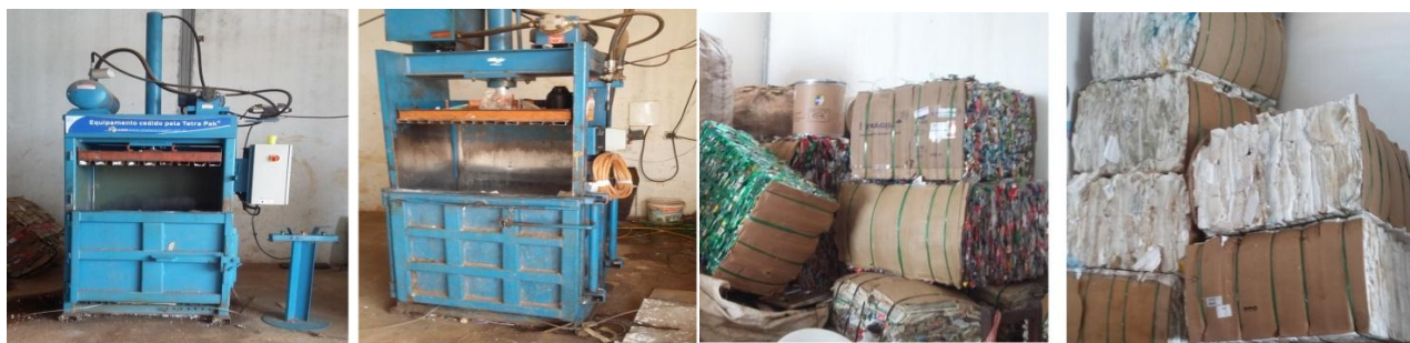
Figura 4 Prensas e armazenamento de materiais (plástico, revistas e poliestireno)

O processo de triagem é semelhante ao da primeira Cooperativa. O material recebido é separado e logo em seguida levado as prensas para serem prensados e armazenados (figura 4). As prensas pertencentes à Cooperativa II foram doadas pela empresa Tetra Pak exigindo apenas que esta trabalhe com as embalagens da empresa