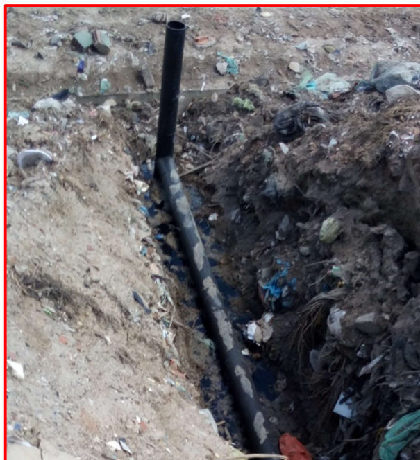
Figura 5. Vista do tubo de PEAD de 160mm utilizado como dreno

Após ligar e calibrar o GEM5000 realizou-se a conexão do equipamento ao cabeçote do dreno e a leitura da concentração dos gases durante 120 segundos em cada uma das 04 posições da válvula. Entre as leituras realizou-se uma "purga" de 15 segundos no equipamento (leitura ao ar livre para limpeza)