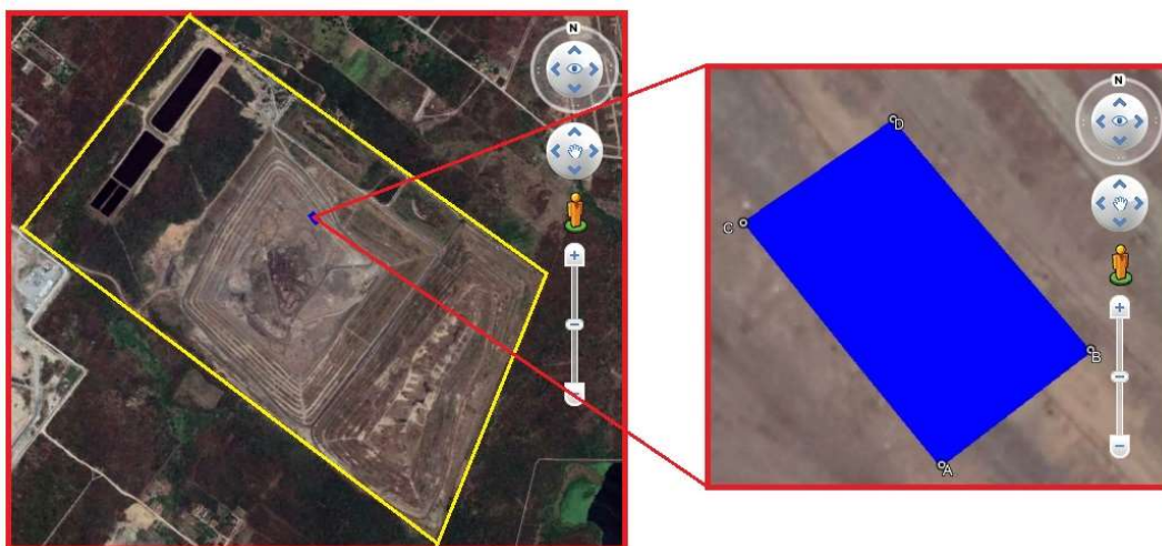
Figura 1. Limites do Aterro Sanitário de Caucaia (em amarelo) e localização da área pesquisada (em azul)

A área pesquisada tem 929m^2 e 125m de perímetro. É composta por duas bermas e um talude. Seus limites são apresentados na Tabela 1.