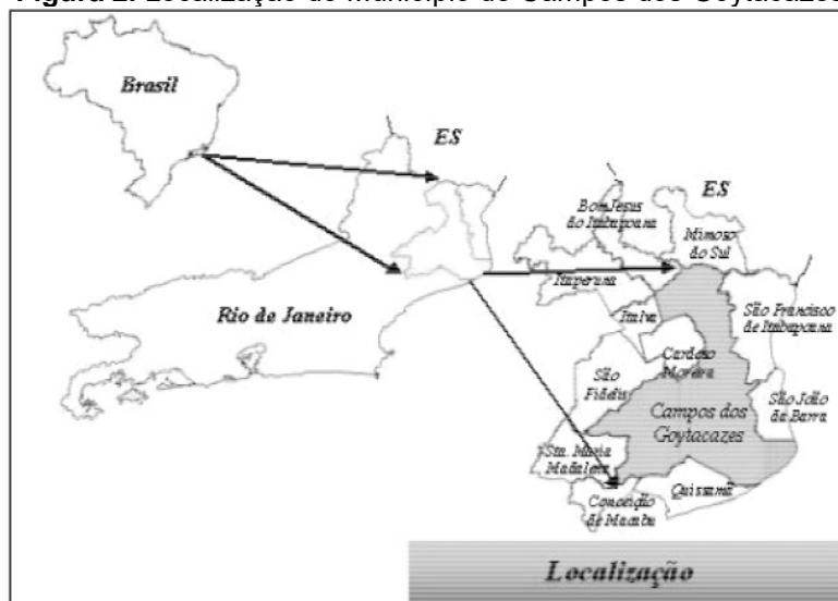
Figura 2. Localização do Município de Campos dos Goytacazes