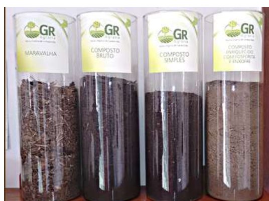
Figura 1. Fases dos compostos gerados

Desde 2014, o município de Campos dos Goytacazes possui uma empresa privada que realiza a compostagem dos resíduos sólidos urbanos concomitante aos resíduos agroindustriais resultantes do abate animal, transformando-os em um composto de alta qualidade e valor para a agricultura, sem prejudicar o meio ambiente (GR AGRÁRIA, Sd).