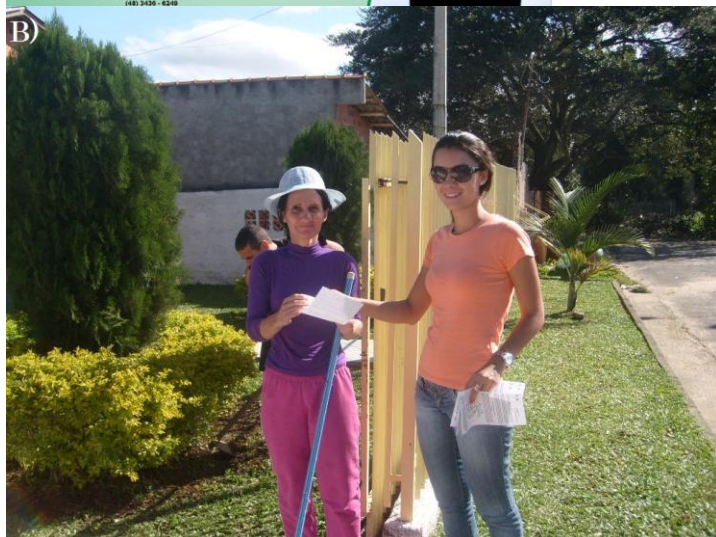
Figura 02: (A) Banner distribuídos em escolas, CRAS, igrejas e posto de saúde, (B) Folder distribuído nas residências do bairro São Francisco.